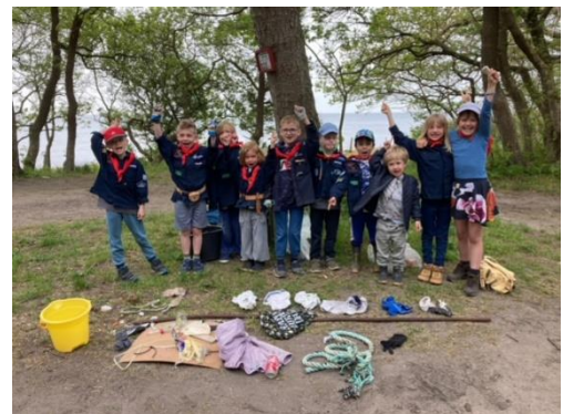
Fastelavn ved hytten og Strandrens ved Busende have