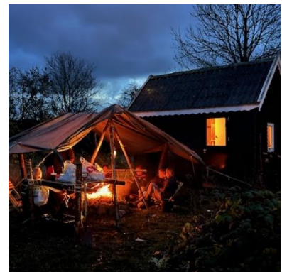
Lejr slagning på Økseløbet og Tropsweekend med Bålvogtermærke i regn og stormvejr.