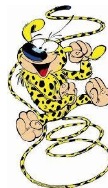
Klanens maskot Spirillen

Klanens aktiviteter i 2023 har måske været af blandet karakter, men vi har hygget os rigtig fint sammen og fået et godt sammenhold og det har været det vigtigste for os.