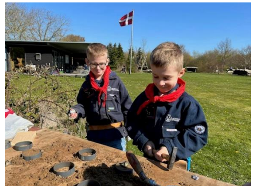
Bueskydning med Robin Hood og Tinstøbning i sand til Sct. Georgs mødet