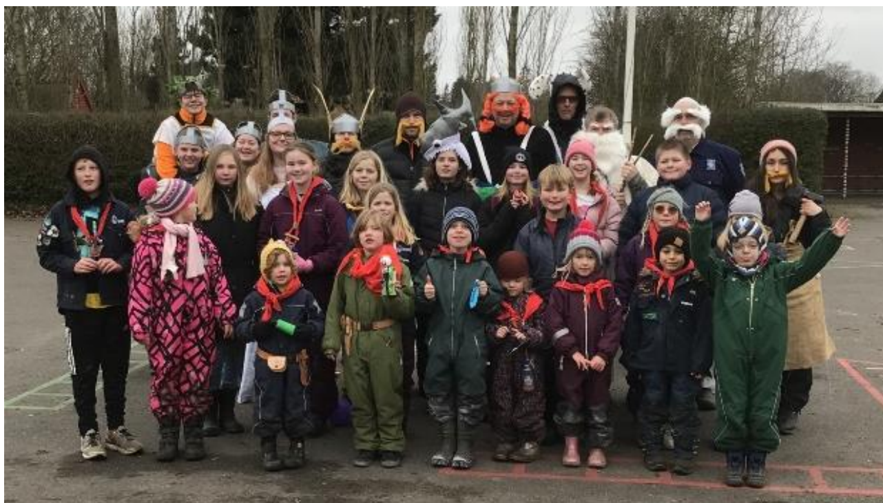
Forventningsfulde Mønspejdere på Asterix og Obelix gruppeweekend, hvor lederne har klædt sig ud til temaet