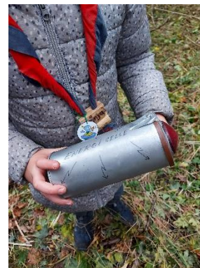
Lederen blev fanget, men vi fandt energicellen

Alt i alt har det igen været et år med utrolig meget spejderaktivitet. ca. 300 timers spejd i alt slags vejr i Minigrenen, plus lige så meget forberedelse for de frivillige ledere.