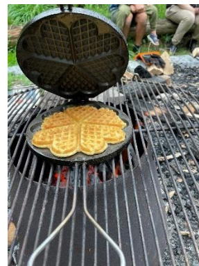
Familiespejderne har lavet fuglefodnings ophæng, støbt naturspor og sluttet et møde af med lækre vafler