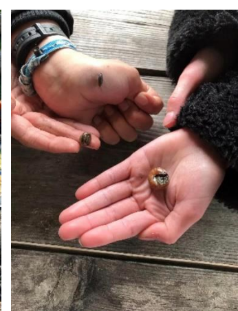
Billeder af tre af de ting der altid hører med til spejderlivet: Pionering med rafter, mad over bål og naturens dyr