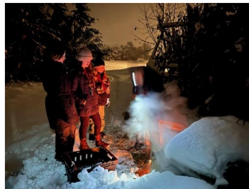
Troppen har pioneret et spisebord og nyder at lave bålmad

Blandt højdepunkter fra den forgangne sæson kan nævnes.