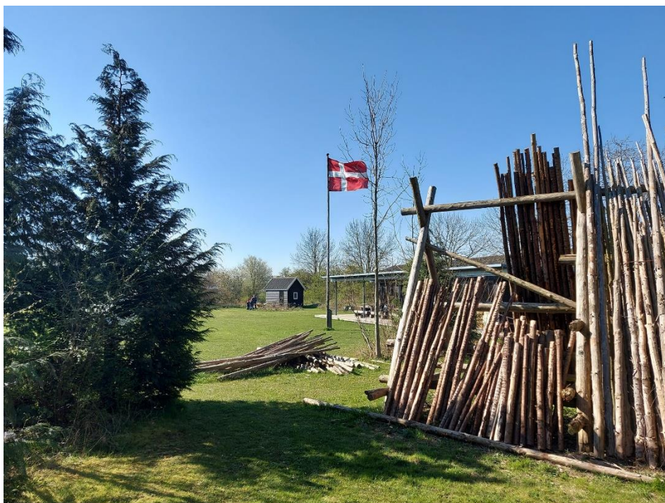
Mønspejdernes base, spejdergrunden "Den blå Oase" på en dejlig solskinsdag