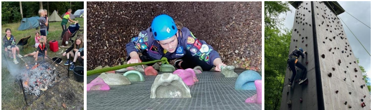
Lejrliv på sommerlejren på Sletten i Ry. Troppens friluftaktiviteter bød på klatring på klatrevæg, Alle nåede toppen.

Lejren var en hel uge, der bød på; Tre dages kanotur på Gudenåen sammen med juniorerne, lejropbygning på Sletten med telte og spisebord bygget i rafter, vandretur og topbestigning af Himmelbjerget, sejltur med verdens ældste Dampskib "Hjejlen" og en dag med vægklatring og øvrige friluftaktiviteter i lejren. Det var alt i alt en fantastisk god sommerlejr og det er jo altid hyggeligt når vi er flere grene sammen på sommerlejr.