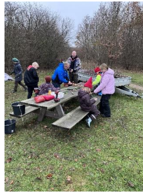
Familiespejderne spiser og leger ved shelteren og deltog i det fælles julemøde