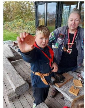
Rekvisitter fra et af mikro-miniernes Oldtidsmøder, med hugning af flinteredskaber og prægning af lædermærker