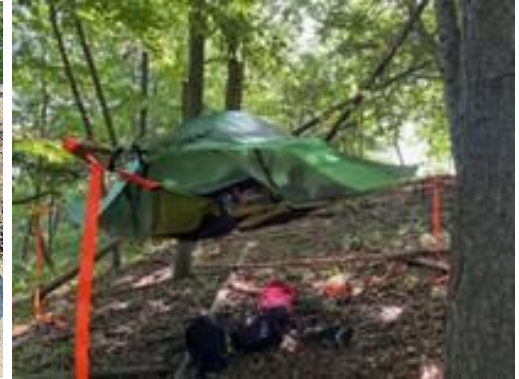
Ild med tænd stål og forstørrelsesglas og Trætop-telt på sommerlejren

Af fællesmøder i efteråret 2023 kan nævnes et fantastisk forløb med "Oldtidsmøder" hvor vi arbejdede med Jæger-samler samfund, Stenalderen, Jernalderen, Bronzealderen og Vikingetid. Derudover har vi arbejdet med håndtering af Dolk, Økse og Sav samt flere andre spejderfærdigheder.